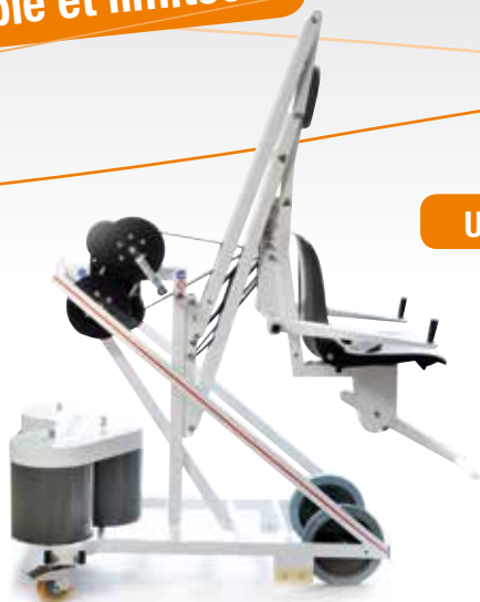
Unikart 300 classic