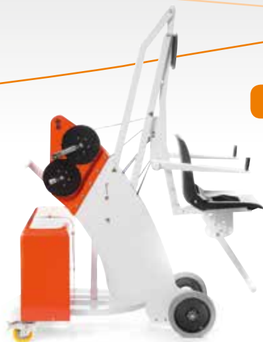
Unikart 300 design